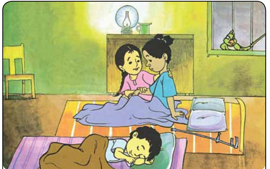
மிதிவெடிகளால் பாதிக்கப்பட்ட சிறுவர்களுக்கு அனுசரணையாய் இருந்து ஆதரவளியுங்கள்

பல்வேறு விதமான கண்ணிவெடிகள் உபயோகிக்கப்பட்டன. சில வெளிநாடுகளிலிருந்து இறக்குமதி செய்யப்பட்டன. மேலும் சில வடக்கிலேயே உற்பத்தி செய்யப்பட்டன. இவை தவிர மோட்டார்கள் மற்றும் வேறு வெடிபொருட்களைக்கொண்டு கண்ணிவெடிகளாக உபயோகித்த சந்தர்ப்பங்களும் உண்டு.